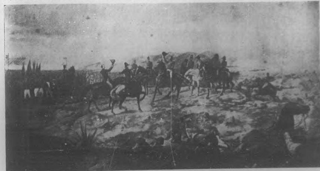
Un episodio de la batalla de Ayacucho.

El General en Jefe, como un cóndor que escudriña en el espacio infinito sobre su hermoso caballo, color de sangre de escudador por el sol, las tropas de su mando y prende en cada corazón una flor de esperanza, y el