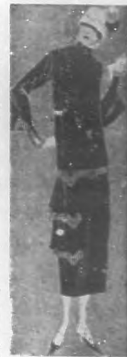
Ultimo modelo para invierno, recibido en "La Moda Francesa" en San Miguel 70. Es de terciopelo negro con galón de fantasía.

Puedo contarle un caso práctico de lo que puede la voluntad, cuando nos convencemos que para nuestro bien hay que aplicarla. Una joven de color, que estudia para profesora de escuelas públicas (Pasa a la Pág. 26.)