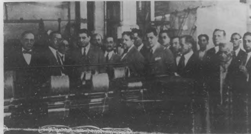
Máquina de hacer bobinas.