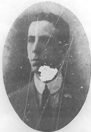
GUSTAVO SANCHEZ GALARRAGA Eminente poeta cubano, que acaba de dar con éxito insuperable un recital en la Sorbona

BOHEMIA, que frecuentemente engalana sus páginas con versos del bardo triunfador; y que lo cuenta, enorgulleciéndose de ello, como uno de sus más prestigiosos colaboradores, le envía su parabién más efusivo y aprovecha la coyuntura para emitir su juicio de que Galarraga es uno de los pocos grandes poetas que actualmente prestigian la Literatura Cubana.