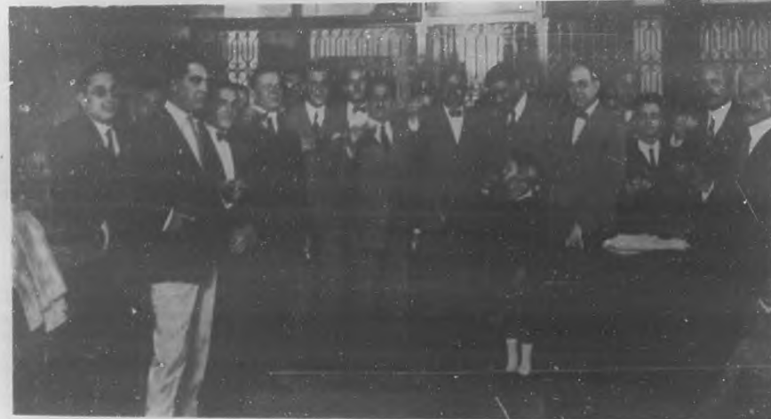
Visitantes y altos empleados brindando por la prosperidad de la industria cubana.

El señor Vidaurraga se ofreció a enseñar a los visitantes todos