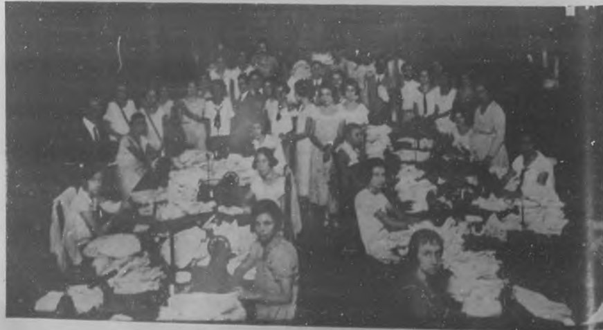
Departamento de preparación de cortes.