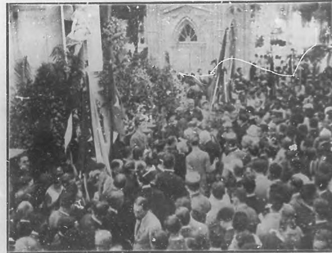
LA CONMEMORACION DEL 27 DE NOVIEMBRE. —Un aspecto de la concurrencia que asistió a los actos celebrados en el Cementerio de Colón, en conmemoración del fusilamiento de los estudiantes.