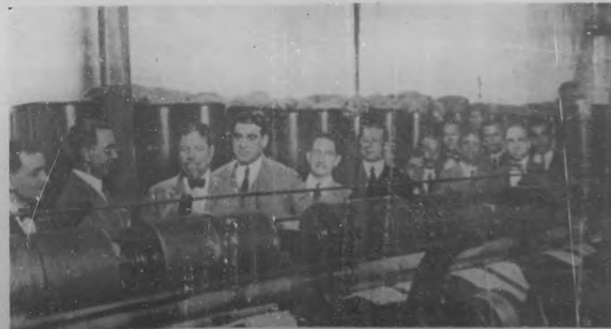
Los visitantes viendo el funcionamiento de una máquina de hacer mechas.