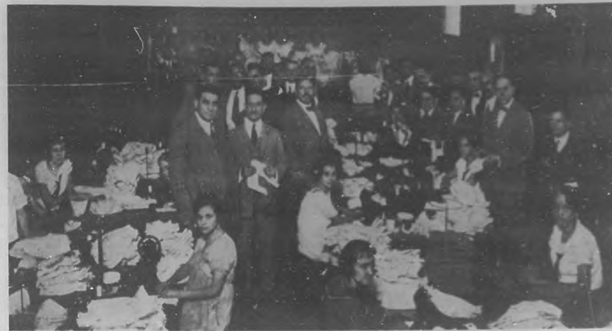
Otro aspecto del departamento de preparación de cortes.

ministrador general de la misma durante diez años. Los talleres ocupan una extensión de 4.500 metros cuadrados, teniendo capaci-