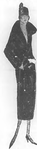
Abriego de terciopelo, muy práctico y sencillo. Cuello del mismo material. Está adornado con cuatro botones de seda mate en la parte baja del mismo. En cualquier color oscuro, resulta muy elegante.

de laboriosidad y de energía. La pérdida de un palacio, de ricos autos, de hermosas joyas y de vastas posesiones es, ciertamente, cruel; pero después de los primeros tiempos de amargura y pesar, la señora, que es entonces propietaria de una pequeña habitación, de un sencillo chatel y se ve obligada a contentarse con el viaje de tranvías y con las joyas de fantasía, reconocerá que es más fácil y sencilla la vida sin tantas complicaciones; una sola sirvienta que vigilar, en vez de un ejército de criados; un solo salón que tener arreglado; ningún invitado a quien obsequiar y divertir; no más automóviles que constituyen un peligro de muerte cada vez que se sale en ellos; no más testos en brillantes y perlas que se temen perder o que se van rotando. Lo poco que le queda, le parece muy suyo, lo ama más, porque lo conoce mejor y le dedica todos sus cuidados. Un escritor inglés, Thoreau, ha dicho: "¿Por qué tratar siempre de poseer más? ¿Por qué no procurar, por el contrario contentarnos con menos? Los más sabios llevaron siempre la vida frugal y sencilla de los pobres." Y la salud mejor, en efecto, con la persona que fuera débil de naturaleza y recuperara sus fuerzas, sus gracias y su salud, al dedicarse a una vida activa. También para el espíritu, es muy bueno hacer vida beneficiosa para sí y los demás. Pero por desgracia, muy pocos son los que a tiempo ven el pro y el contra de la vida.